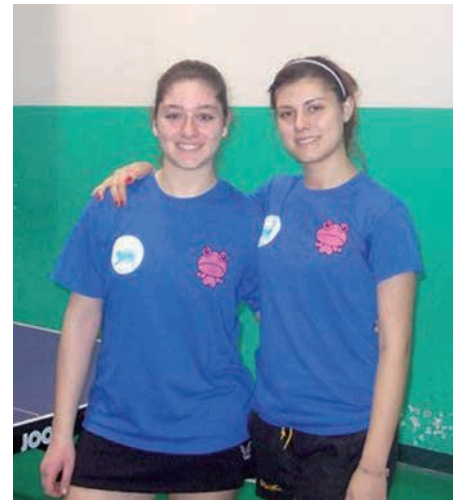
A DESTRA LE RAGAZZE DEL B FEMMINILE