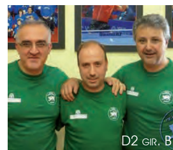
D2 GIR. B