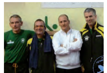
SOPRA LA FORMAZIONE D1 GIR. A